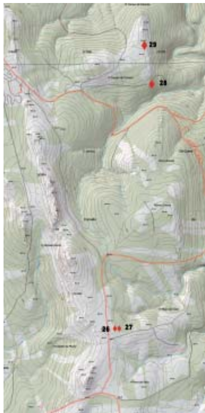
Mapa 4.- Situación dos gravados de Lombo de Egua-Pena Carqueixa e Pena Cruzada de sobre Cortizas (San Fiz de Monfero).

base do afloramento unha pía de 85 N-S x 52 cm L-O, que posiblemente sexa artificial.