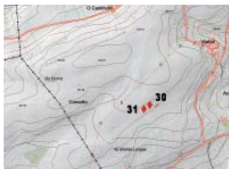
Mapa 5.- Situación dos gravados de Caldoval (San Fiz de Monfero).

únicos afloramentos graníticos con gravados que atopamos na parroquia de San Fiz. Este primeiro está a ras do chan, e ten 1,30 N-S x 2,30 m L-O. No L podemos ollar dúas cazoletas e unha raia con forma de cuñeira; ao O once cazoletas e unha pequena cruz.