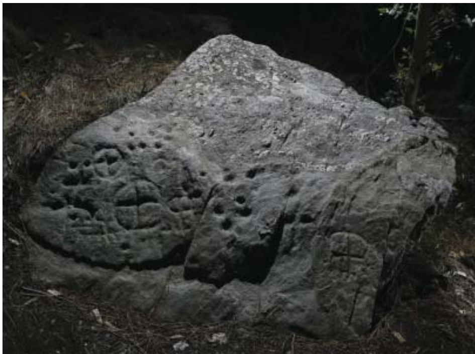
Foto 11.- Conxunto de gravados do panel Pena Bicuda-2 (San Fiz de Monfero).