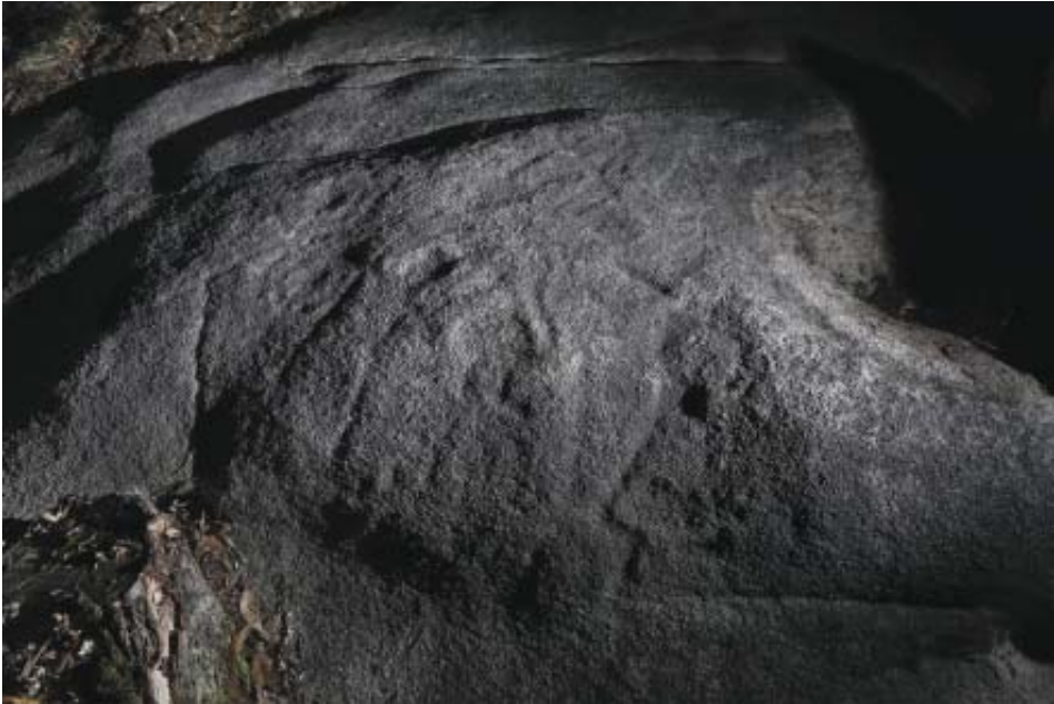
Foto 6.- Conxunto de gravados do panel O Pico (Vilachá). En primeiro plano, posibles figuras antropomorfas.