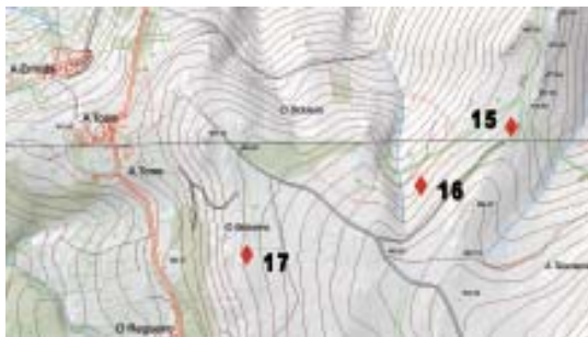
Mapa 2.- Situación dos gravados do monte de San Bartolo (San Fiz de Monfero).

16) Marco do Monte de San Bartolo (coordenadas 578892 - 4805128, xeográficas 8° 01' 32,23" - 43° 23' 38,75", cota de altitude 488 m). Trátase dunha pedra exenta, probablemente un marco, que foi tumbado. Ten unhas dimensións de 1,75 N-S x 0,78 m L-O. Actualmente