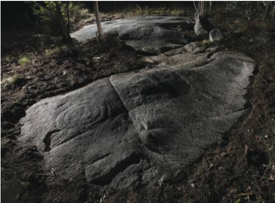
Foto 7.- Vista xeral dos gravados do panel O Pico (Vilachá). En primeiro plano, espiral destróxima.