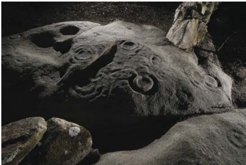
Fotos 2 e 3.- Conxunto de combinacións circulares ao oeste do panel Edreiros-1 (Vilachá).